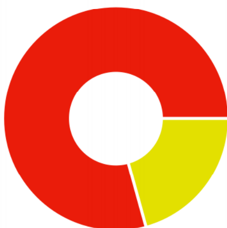
Ekvivalens energia fogyasztás

Földgáz: 339 943,614 kWh Villamos energia: 1 302 306,75 kWh