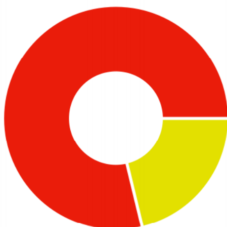
Ekvivalens energia fogyasztás

Földgáz: 309 989,725 kWh Villamos energia: 1 149 329,75 kWh